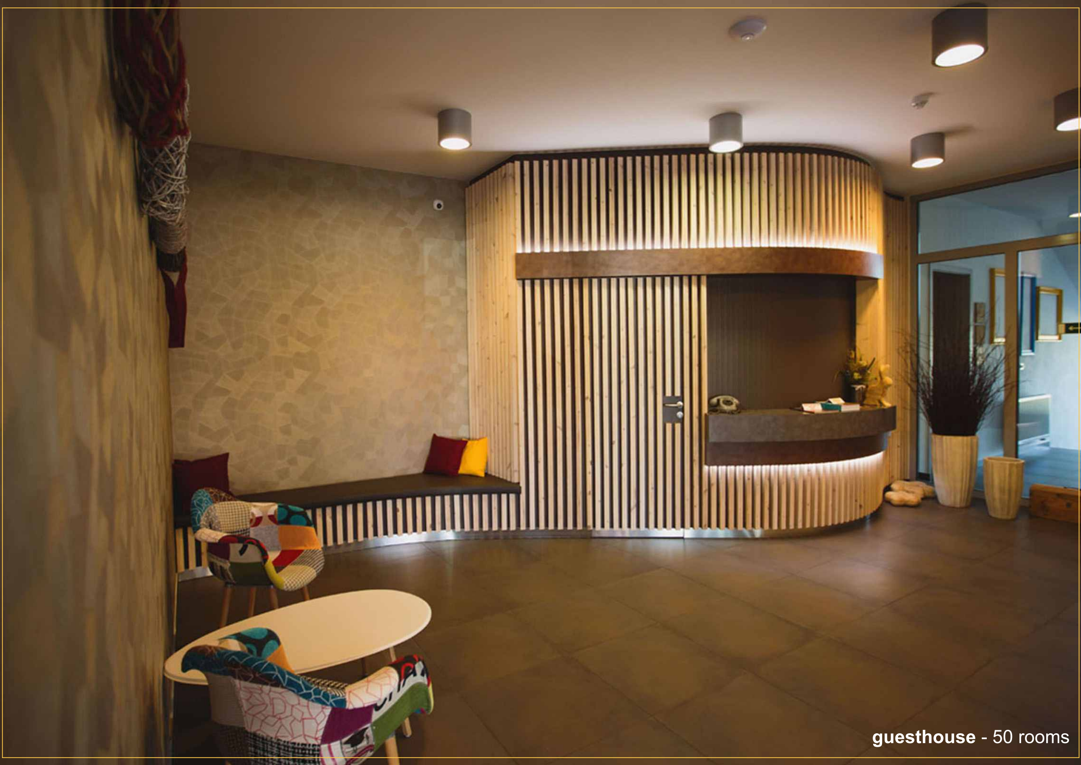
guesthouse - 50 rooms