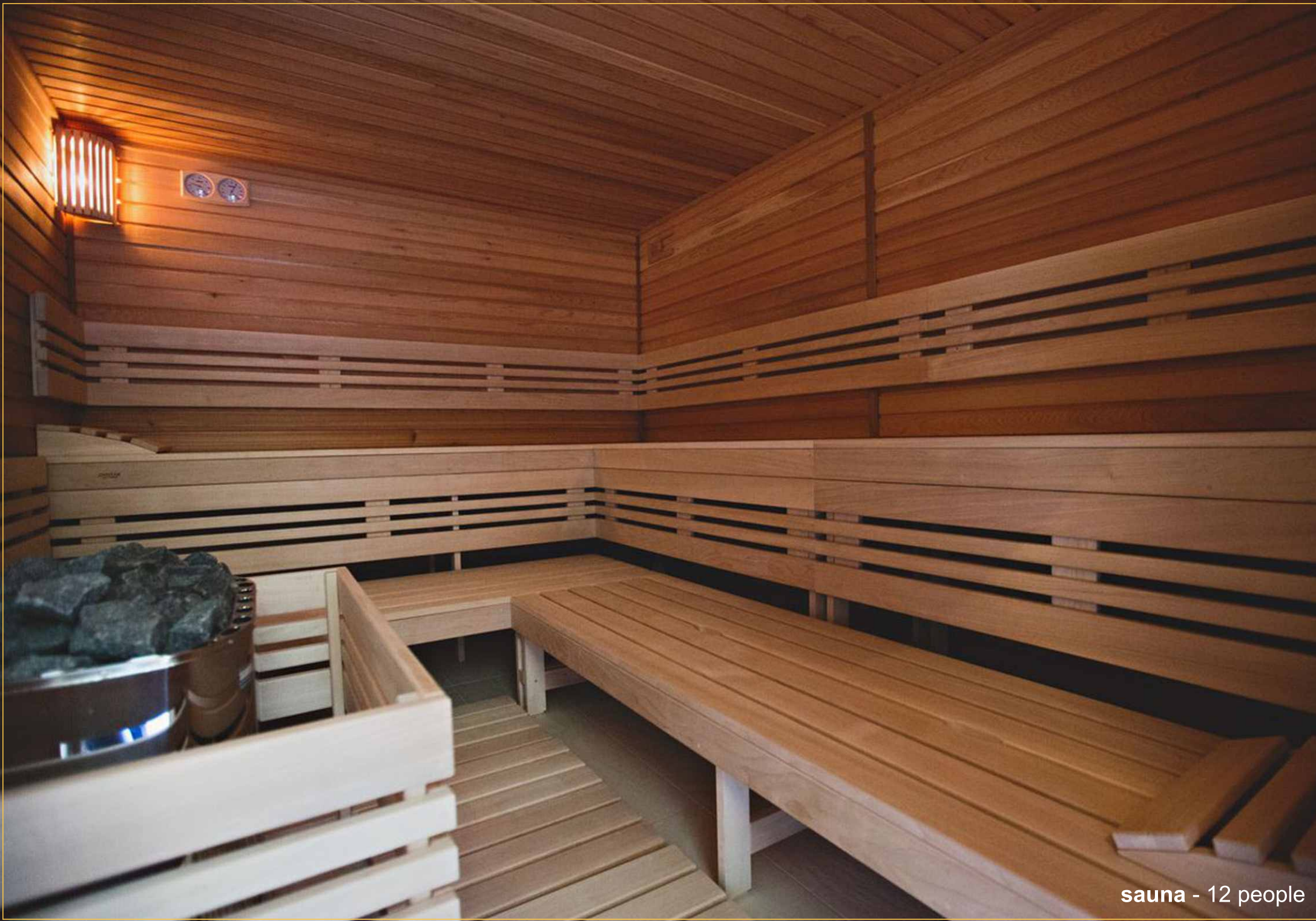
sauna - 12 people