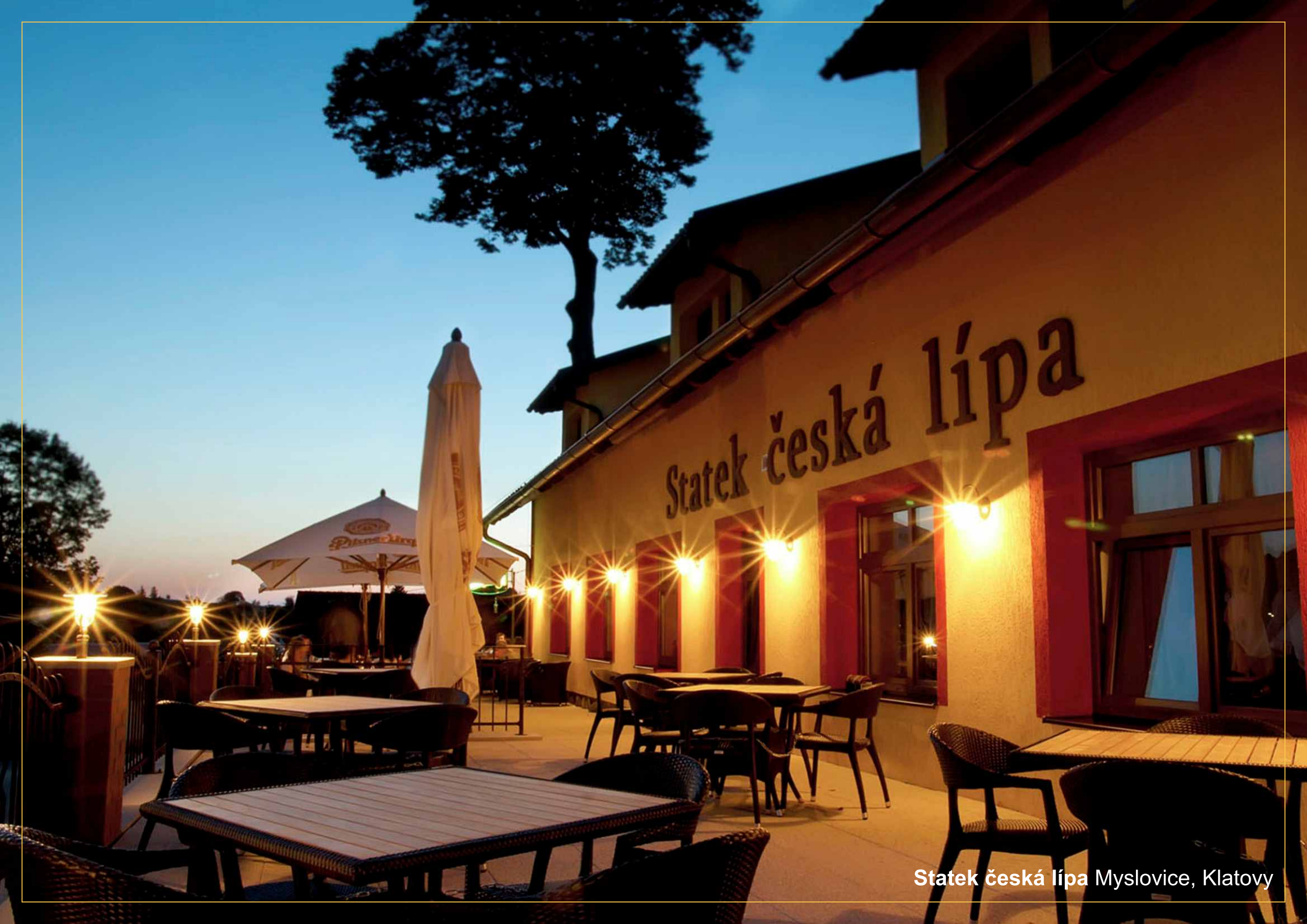
Statek česká lípa Myslovice, Klatovy