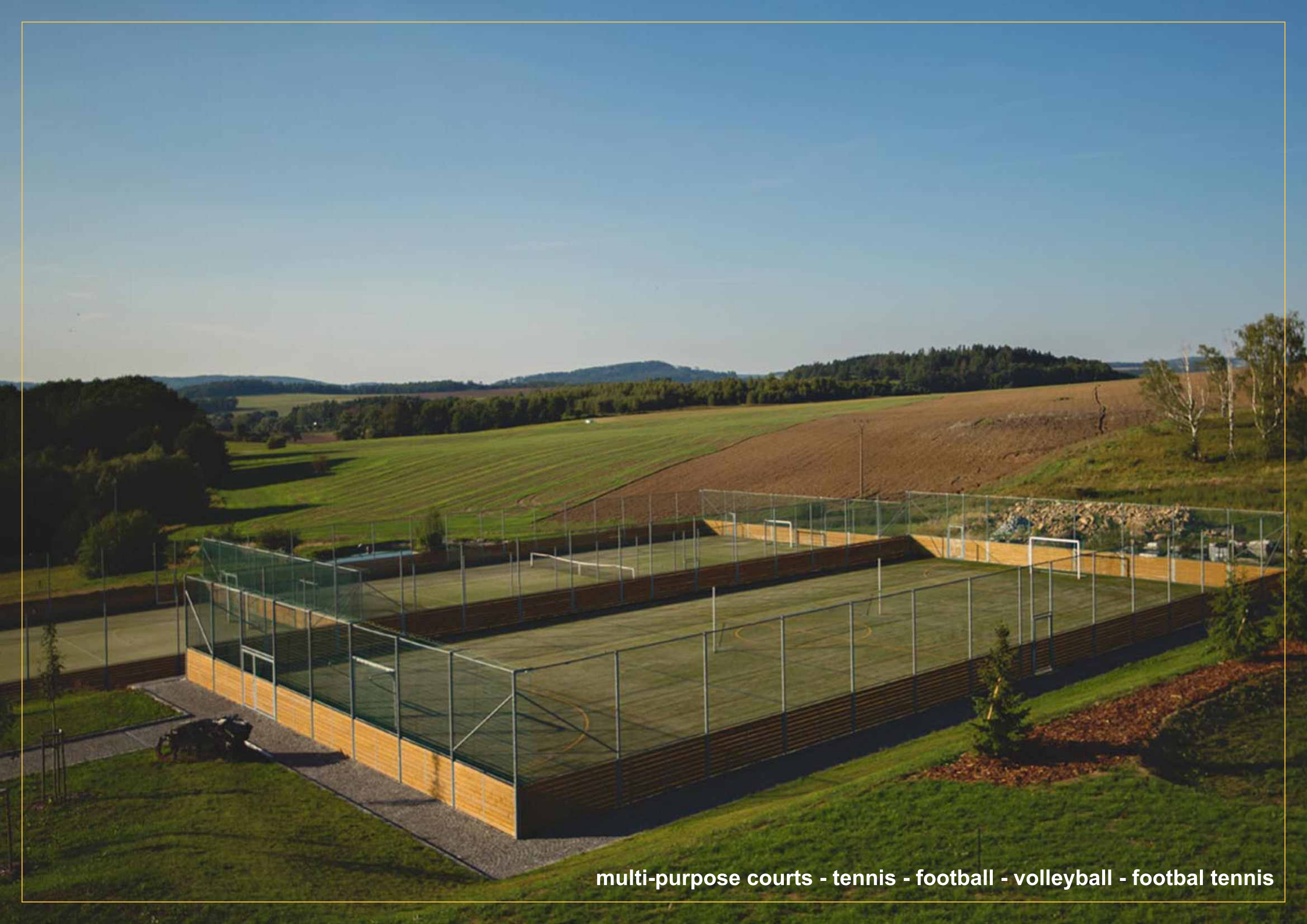
multi-purpose courts - tennis - football - volleyball - football tennis