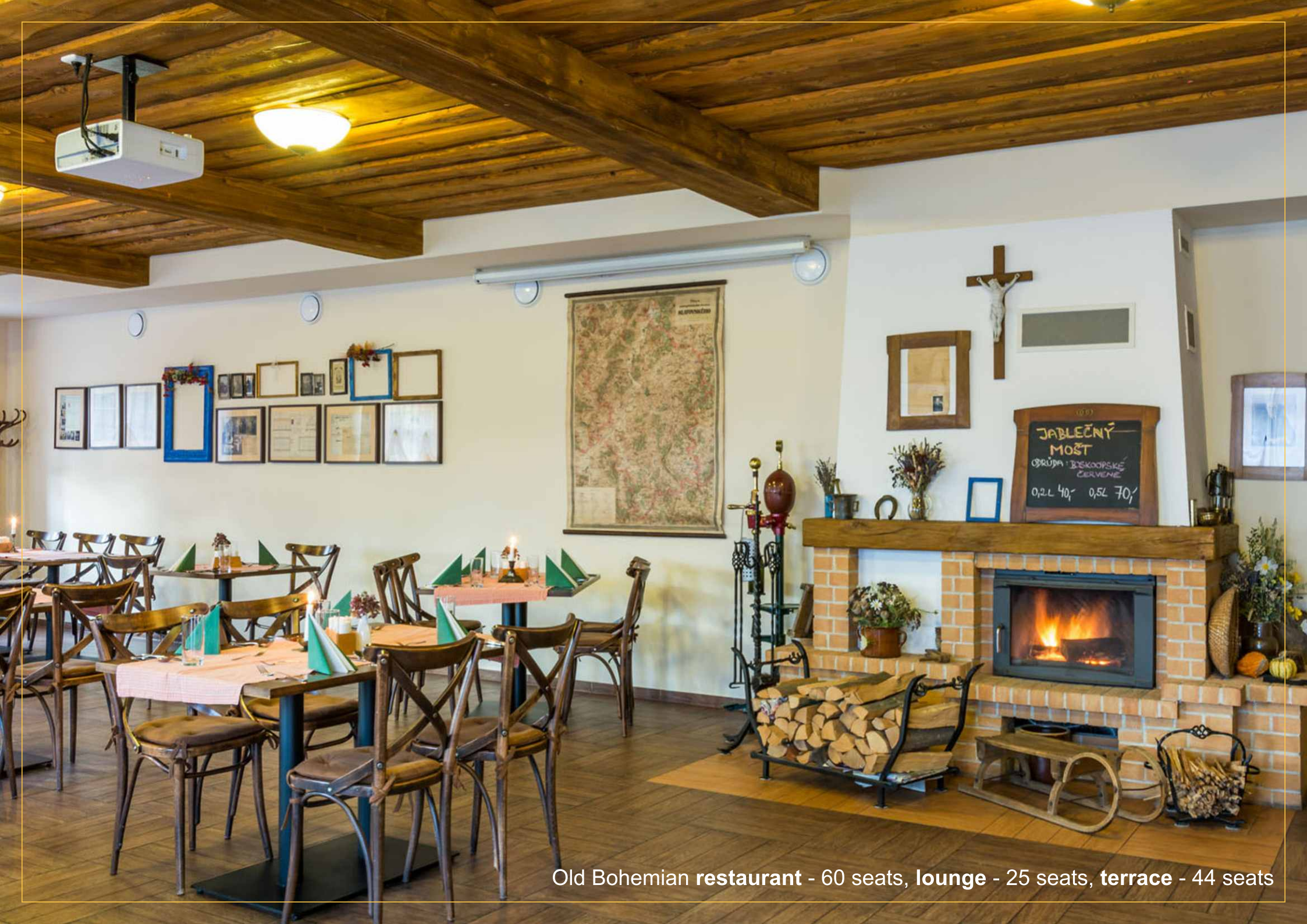
Old Bohemian restaurant - 60 seats, lounge - 25 seats, terrace - 44 seats