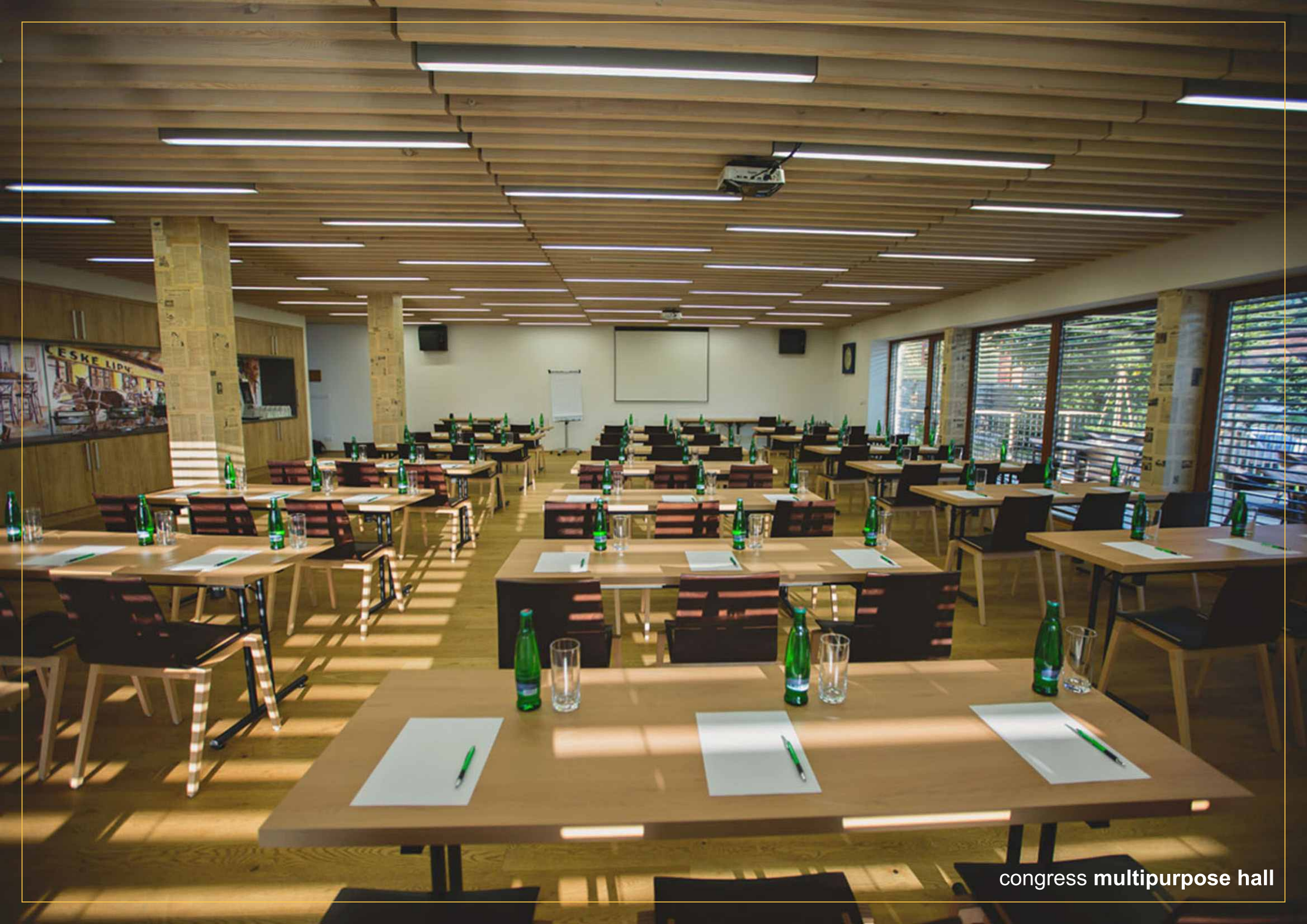
congress multipurpose hall