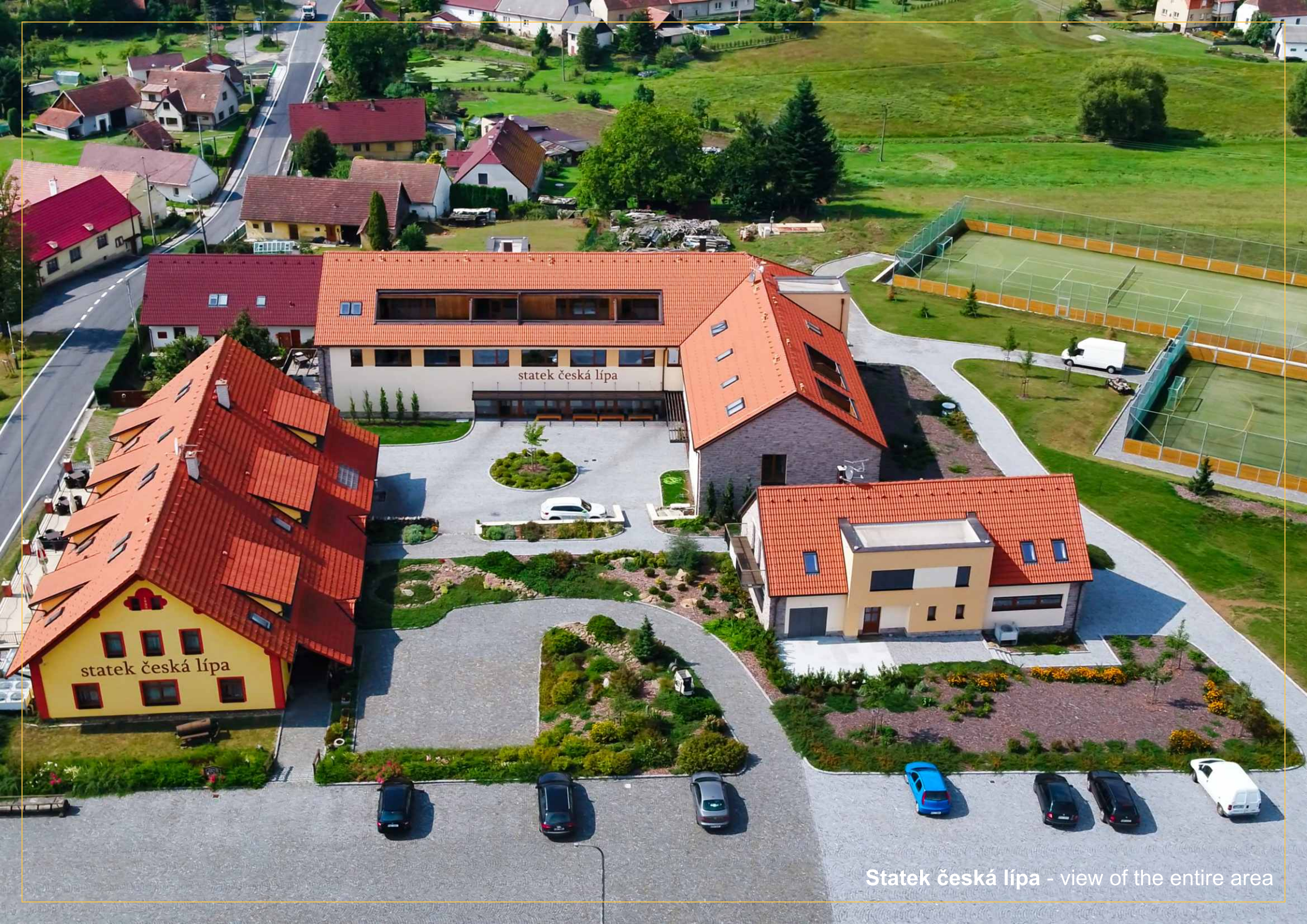
Statek česká lípa - view of the entire area